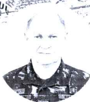
General de Exército JOSÉ RICARDO VENDRAMIN NUNES